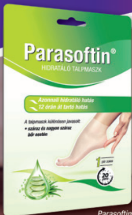
Parasoftin Hidratáló talpmaszk 1 pár

Innovatív megoldások a talp bőrének intenzív és kényelmes ápolására.