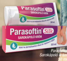
Parasoftin Sarokápoló krém 50 ml