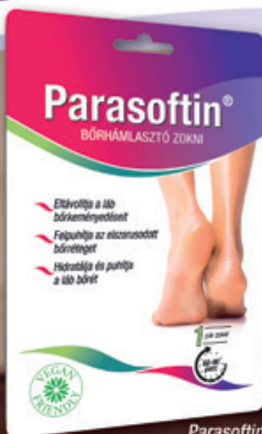
Parasoftin Bőrhámlasztó zokni 1 pár